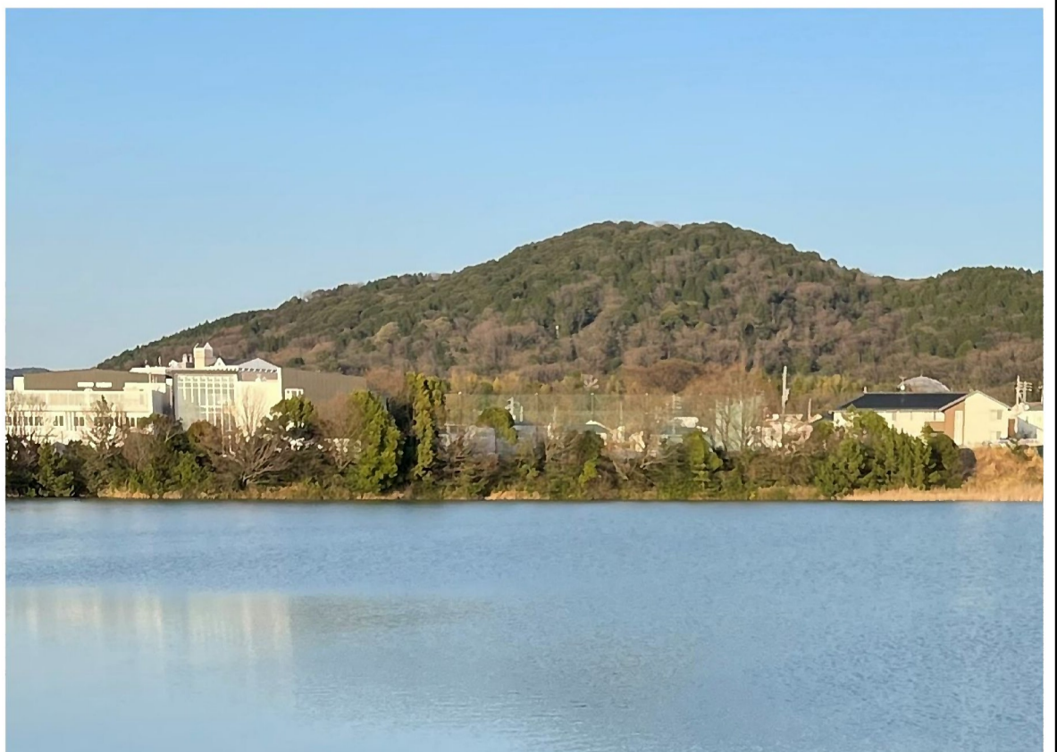
大久手池から東谷山の眺望 (左側が上志段味小学校)