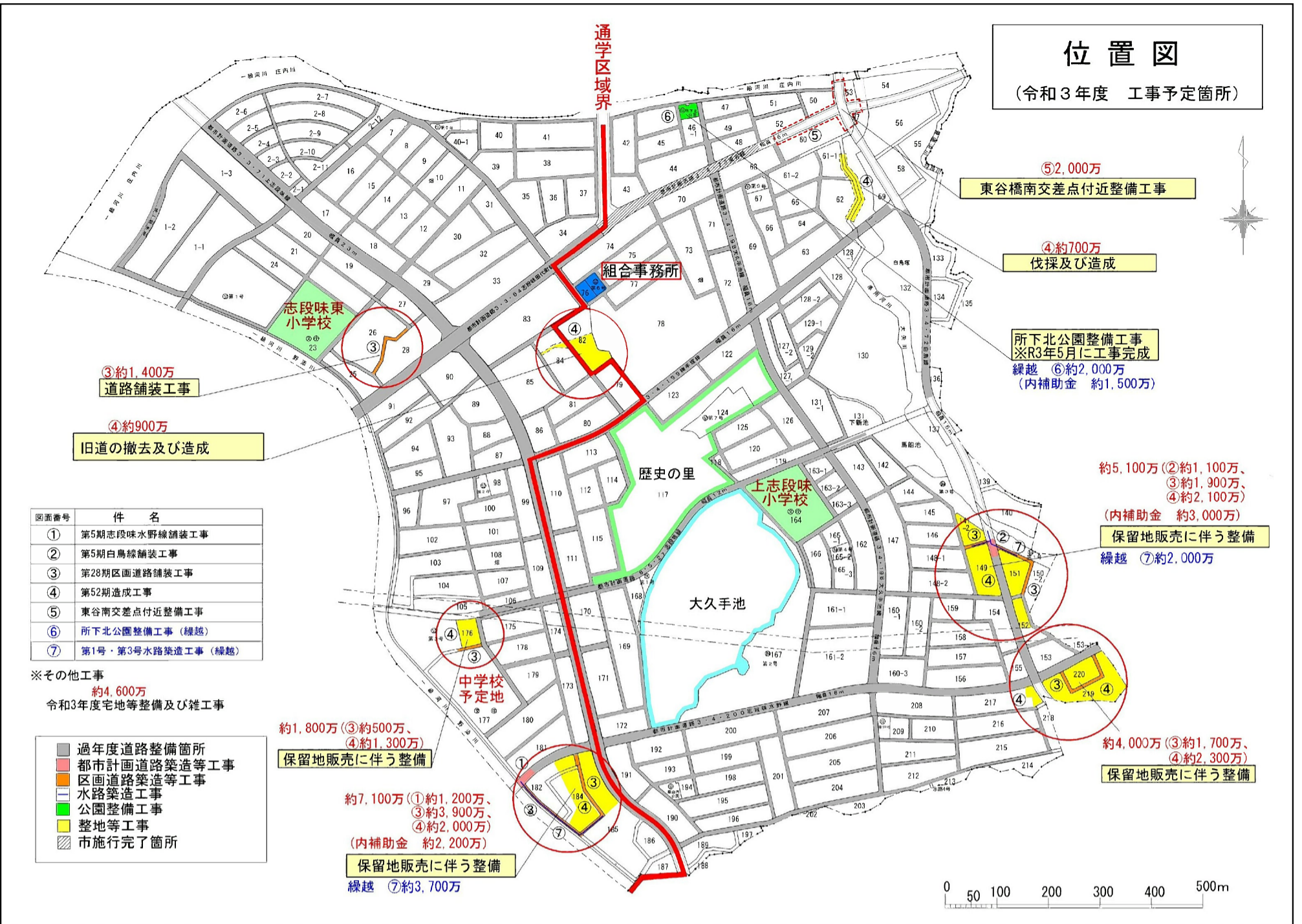
位置図 (令和3年度 工事予定箇所)