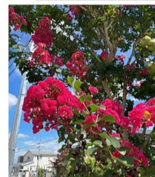
サルズベリ (大久手池線にて)

発行 名古屋市上志段味 特定土地区画整理組合 TEL 736-5200 (代表) FAX 736-5201