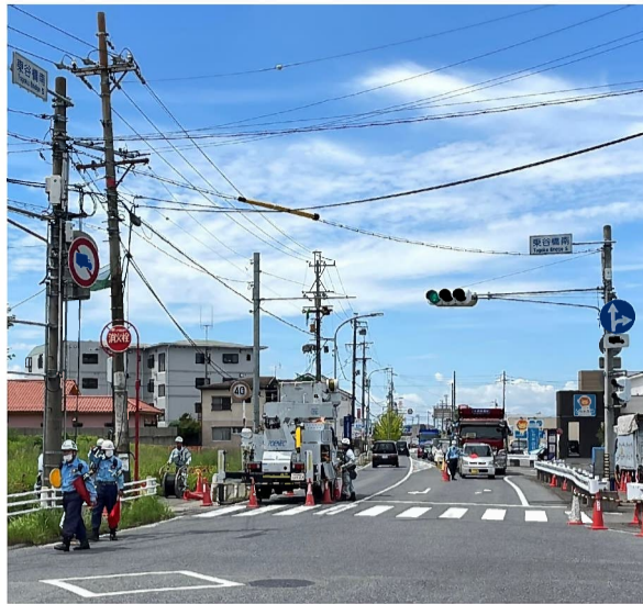
東から西向きに望む